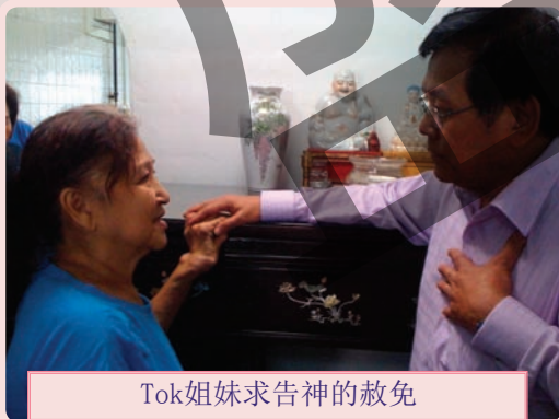
Tok姐妹求告神的赦免

蒙爱的，我们已被托付了我们的主的名，得以医治，赶鬼和传讲福音。这是我们在他的教会中被授予的特权。不断赞美我们的主。