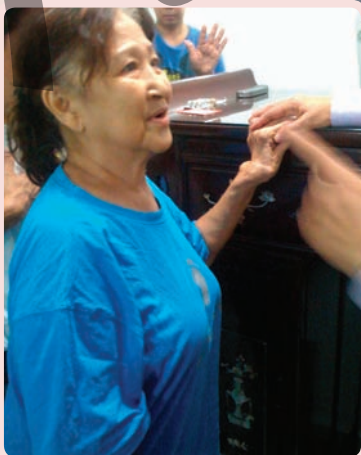
赞美主，Tok姐妹接受耶稣基督为她的救主与主