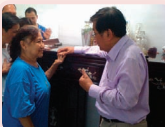
Tok姐妹与工匠做的偶像断绝接触