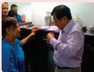
Tok姐妹弃绝她以前与假神敬拜的关系