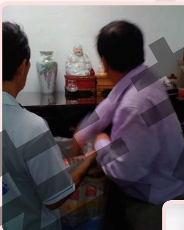
主任郭牧师毁了其他假神敬拜有关的物品 - 奉我们的父，子与圣灵的名